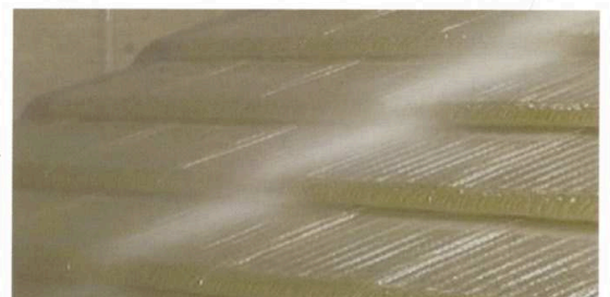
ポリフォーム工法：ポリフォームで接着

風速50mから瓦が暴れだし、風速60mを超えるとビスが抜け落ち、瓦が次々と飛ばされます。