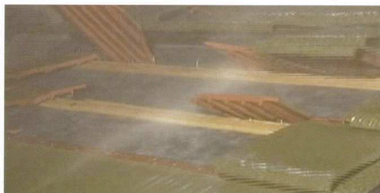
従来工法：ビス2本で固定

風速50mから瓦が暴れだし、風速60mを超えるとビスが抜け落ち、瓦が次々と飛ばされます。