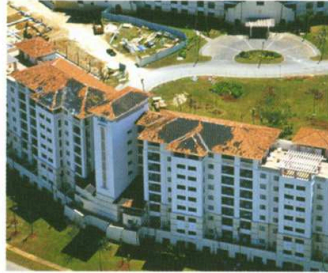
2002年グアム島を襲った最大風速80m以上の台風[ポングソナ(Pongsona)]による被害。

平部はもちろん、瓦屋根の弱点と言われる棟やケラバ、谷、軒先も、どんなに強い台風や地震、大雪が来ても安心です。